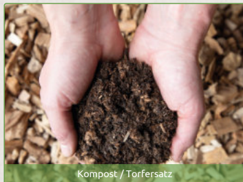
Kompost / Torfersatz